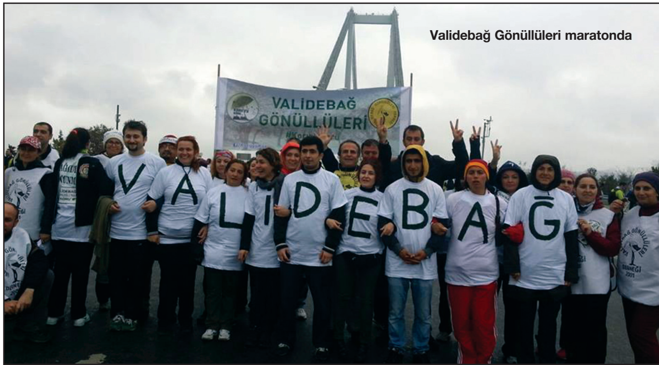
Validebağ Gönüllüleri maratonda